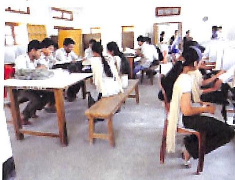
Library Reding Room